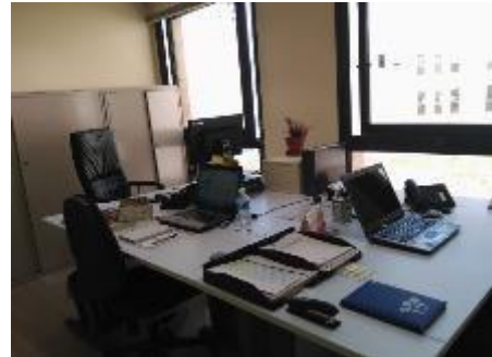
DESPATX ACTUAL AODL I SALA DE REUNIONS

Dins l'àrea també hi ha el servei de turisme. La col·laboració de les dues àrees es estreta, tal com es descriu al pla de treball, en especial en els programes 1 i 3. També col·labora activament amb els serveis de joventut i cultura.