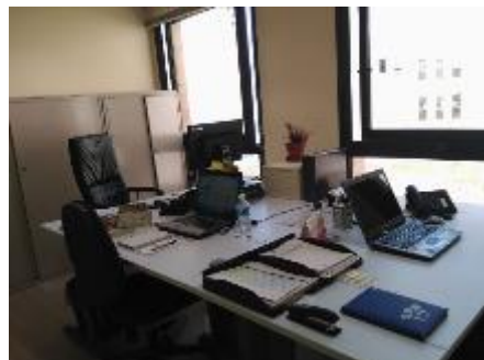
DESPATX PREVIST PER AL NOU/VA AODL I SALA DE REUNIONS